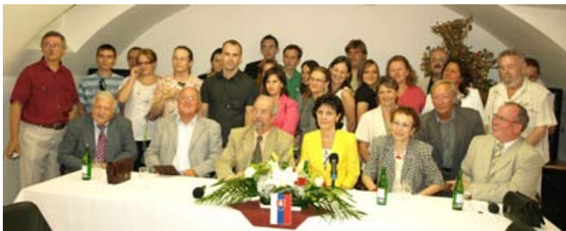
Účastníci slávnostného otvorenia Letnej školy žurnalistiky pre krajanov.